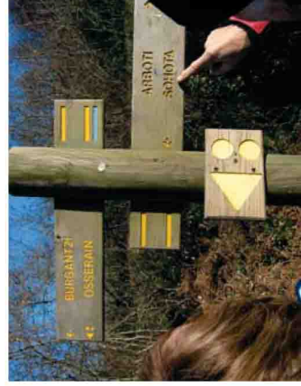
Une photo locale des sentiers ou balisage

Les itinéraires que nous vous proposons ont fait l'objet de la plus grande attention. Vos impressions et observations sur l'état de nos chemins, nous intéressent et nous permettent de les maintenir en état. Nous vous invitons à communiquer vos remarques en contactant l'office de tourisme précisé sur la fiche jointe. Vous pourrez vous y procurer une fiche d'observation Ecoveille®.