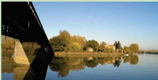
Pont Eiffel sur l'Adour

Circuit pour flâner sur les berges de l'Adour où la barthe forme un rideau de verdure derrière lequel se dissimulent de nombreux hôtes parfois protégés comme la petite tortue nommée cistude.