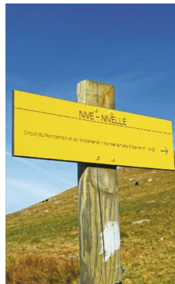
Une photo locale des sentiers ou balisage

Durée de la randonnée : La durée de chaque circuit est donnée à titre indicatif. Elle tient compte de la longueur de la randonnée, des dénivelées et des éventuelles difficultés.