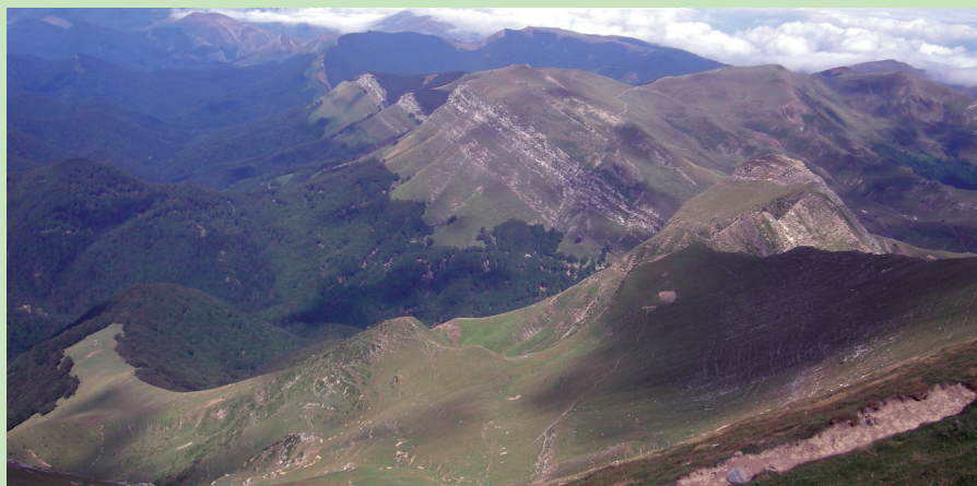
Montagne de Soule

U Partant de l'ouest, les Pyrénées s'élèvent brusquement au niveau de la Haute-Soule. Le pic d'Orhy est ainsi le premier d'une longue suite de géants. Cette situation lui confère un remarquable panorama. Elle donne aussi à son ascension, qui se déroule le long d'une arête vive et aride, un caractère vraiment montagnard. Ce pic est pourtant facilement accessible depuis la création de la route du port de Larrau.