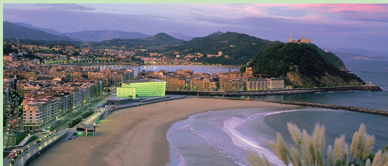
Donostia – San Sebastián