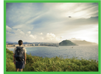
Donostia - San Sebastián

Informazio osagarriak, honako leku hauetan :