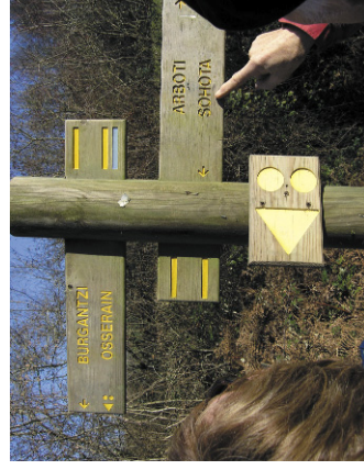
Une photo locale des sentiers ou balisage

: sentier très difficile, dénivelé de 300 à 800 m