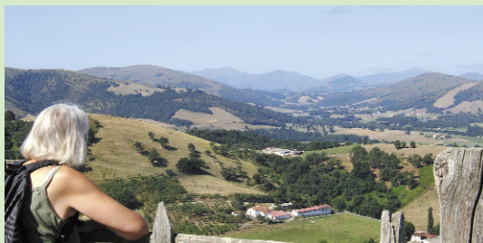
Vue sur la vallée

Promenade agréable sur les crêtes du village. Les nombreuses clôtures qui protègent les cultures imposent les écheliers (« ateka ») qui en permettent le franchissement. Sur la crête, le parcours domine la vallée de la Bidouze et entraîne le regard au loin sur les montagnes du Labourd. A la fin de l'itinéraire, la ferme Larrondoia peut se visiter sur demande et vend du fromage de brebis ainsi que des bouteilles de sagarno.