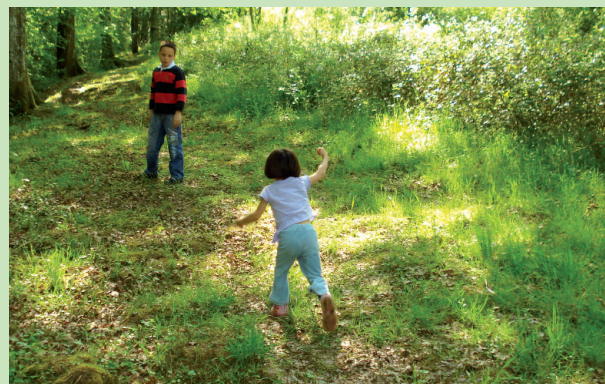
Aventurier en herbe

L'itinéraire se développe au nord du lac du Grècq sur les crêtes bordant le bassin versant. Les ouvertures paysagères vers Orthez ou les Pyrénées alternent avec des passages forestiers et ombragés. C'est un très ancien itinéraire qu'empruntaient les pèlerins de Compostelle et qui reliait la Tarbelli (nom latin pour désigner Dax) à Orthez par la ligne des crêtes.