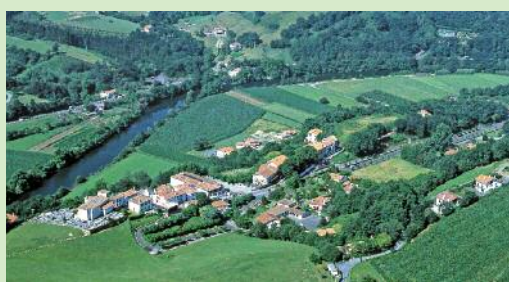
Vista aérea de Biriatu

Desde el pueblo de Biriatu, lugar que merece un itinerario propio, iniciamos el asalto a las colinas vascas. Además de las magníficas vistas del litoral, seguramente nos encontraremos con manadas de pottoks, rebaños de ovejas y buitres leonados.