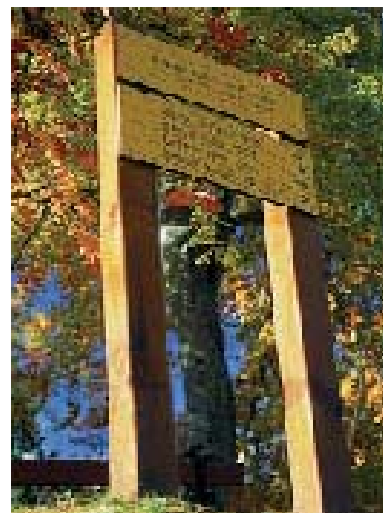
Señalización de los senderos

Duración del recorrido: La duración de cada circuito se ofrece a título indicativo. Tiene en cuenta la longitud del recorrido, los desniveles y las eventuales dificultades.