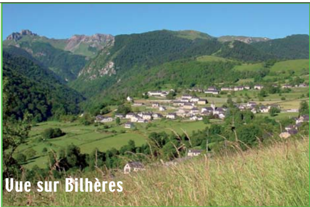
Vue sur Bilhères