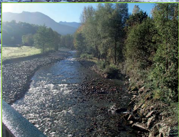
La partie aval du parcours