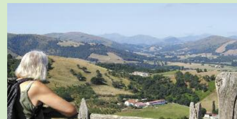
Haranaren alderako ikuspegia

Ibilaldi atsegina herriko gailurretan. Laboreak babesten dituzten hesi anitz baitira, atekak beharrezkoak dira hesi horiek zeharkatu ahal izateko. Gailurrean, ibilbideak Biduze ibaiaren harana du ikusmenean eta Lapurdiko mendi urrunak ikusteko aukera ematen du. Ibilbidearen amaieran, Larrondoa etxaldea bisita daiteke, galdeginez gero. Ardi gasna eta sagarno botilak saltzen ditu.