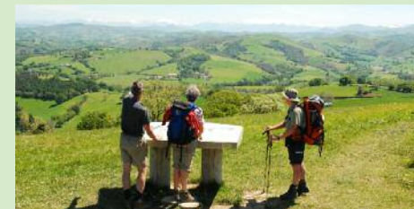
La mesa de orientación

Esta ruta de Santiago sube hacia el oratorio de Soiartz. Allí, el senderista o el peregrino pasajero puede apagar su sed, aprovechar la vista y la estela de orientación que indica los nombres de las cumbres vascas y bearsesas. Al volver, resulta imprescindible pararse un momento en la Halte de l'Escargot para tomar un refresco.