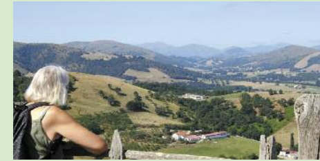
Vista al valle

P aseo agradable por las crestas del pueblo. Las numerosas vallas que protegen los cultivos sólo se pueden pasar subiendo por unas escalas ("ateka"). El recorrido por la cresta domina el valle del río Bidouze y nos lleva a mirar, a lo lejos, los montes del Labourd. Al final del recorrido, se puede visitar la granja Larrondoa mediante solicitud previa; esta granja vende queso de oveja y botellas de sidra (sagarno).