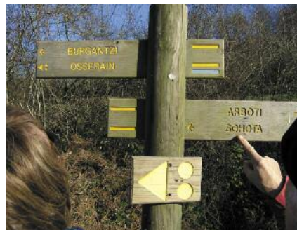
Una fotografía local de los senderos o de la señalización

Los itinerarios que les proponemos han sido preparados con la mayor atención. Sus impresiones y observaciones en cuanto al aspecto de nuestros senderos nos interesan y nos permiten mantenerlos en buen estado. Les invitamos a comunicarnos sus observaciones poniéndose en contacto con la oficina de turismo de Baja Navarra, en Saint-Palais, llamando al +33 5 59 657 178. Allí podrán pedir una ficha de observación “Ecoveille”.