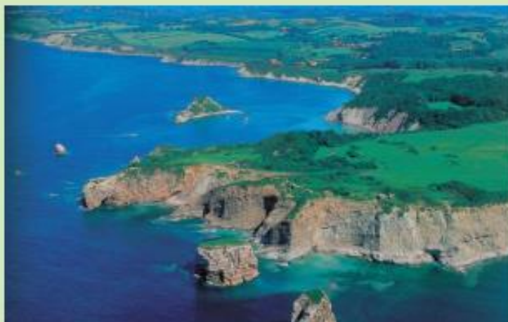
La corniche basque.

La deuxième partie du sentier du littoral, vous offre de magnifiques panoramas du port de Ciboure à celui d'Hendaye. L'itinéraire court le long d'une étroite corniche entre route et falaise. Une fois traversé le domaine préservé d'Abbadia, il s'achève le long de la belle plage d'Hendaye et sur la baie de Txingudi.