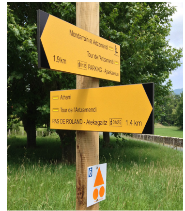
Señalización de las rutas

GR®, GRP® y PR® son marcas registradas por la Federación Francesa de Senderismo. Algunos de estos itinerarios han sido seleccionados por la Federación Francesa de Senderismo en atención a criterios de calidad, se distinguen por el sello PR®.