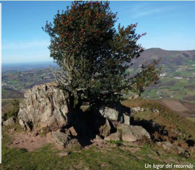
Un lugar del recorrido

R uta de montaña en zona de pastos hasta la cumbre del monte Adarre que ofrece unas espléndidas vistas panorámicas. Posibilidad de adaptar la distancia y la dificultad con tramos adicionales (bucles). Ruta para montañeros con práctica o adeptos de la carrera de montaña (trail). Los tiempos facilitados sirven de referencia para los senderistas.