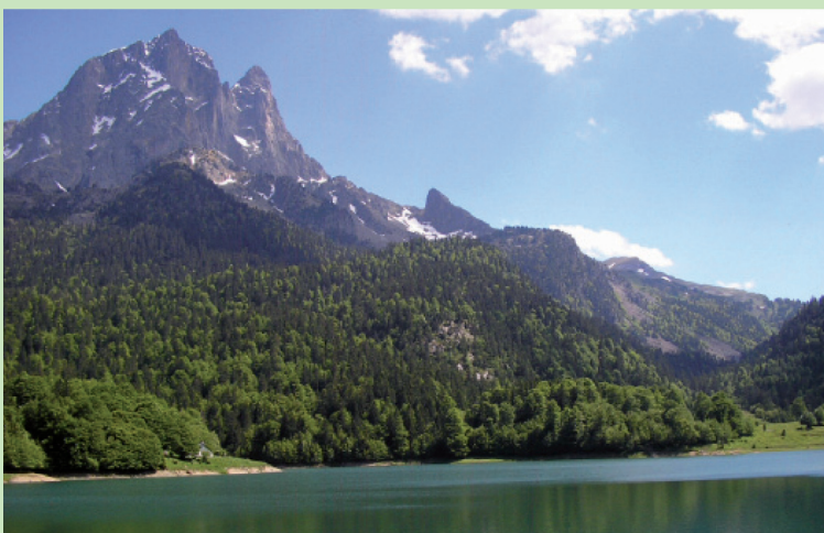
Cara norte del Pico del Midi de Ossau desde el Lago de Bioux-Artigues

G ran clásico para el amante del deporte en el Valle de Ossau. El Pico del Midi, llamado familiarmente Jean-Pierre (Juan-Pedro), deja que lo rodeen en el sentido inverso a las agujas del reloj. Bien trazado y provisto de paneles, el itinerario sin embargo carece totalmente de balizas de señalización dentro del Parque Nacional. Solo apto para senderistas experimentados