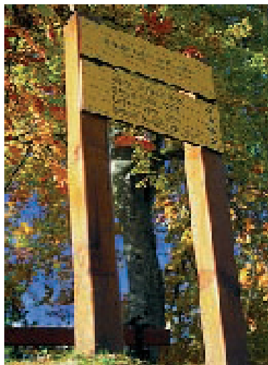
Señalización de los senderos

Duración del recorrido: La duración de cada circuito se ofrece a título indicativo. Tiene en cuenta la longitud del recorrido, los desniveles y las eventuales dificultades.