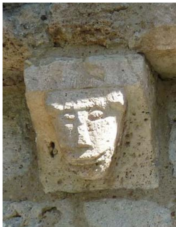
Détail de l'église d'Assouste du XIIème siècle.

1h45 5 710794 E - 4762818 N Au niveau d'une grosse maison à galerie, prendre à gauche un sentier entre des murets qui descend à travers champs. Jolie vue sur Béost. Au bout de 100m suivre à droite un chemin plus large qui rejoint le centre de Béost.