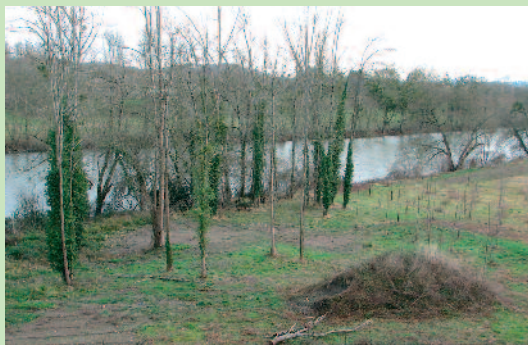
Les bords du Gave.

C ette boucle relie deux charmants hameaux. A l'aller vous suivrez le chemin qui borde les gaves, au retour agréable promenade sur l'ancienne voie ferrée Puyoo-Mauléon.