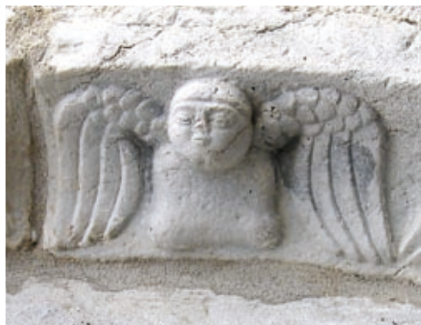
Détail du porche de l'église de Mifaget

deux fois le Landistou. Après le lavoir, à gauche passez un pont toujours sur le Landistou et longez le cimetière. Laissez l'église sur votre droite. Traversez la rue Saint Martin et continuez par un chemin puis une rue le long du Landistou. Passez un pont à gauche et prenez tout de suite à droite. La route qui passe devant la salle des sports vous ramène à votre point de départ.