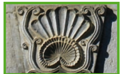
Coquille sculptée sur un linteau de porte

franchissement était l'épisode majeur du voyage à Santiago. On parlait des difficultés de la montagne bien avant d'y arriver et elle inquiétait au fur et à mesure que sa silhouette se profilait à l'horizon. Suivre le chemin de piémont permettait de longer la difficulté et de choisir le moment le plus opportun pour passer.